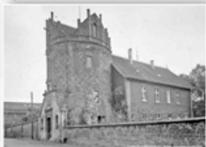
Anno 1941 - der Holkensturm an der Wallstraße hat einen Innenum-Durchmesser von 6,30 m, eine Wandstärke von 1,12 m und eine Höhe von 12 m.