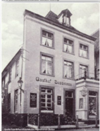
Anno 1942: Gasthof Rossmann Dieser Gasthof war jahrzehntlang Betriebskantine vor und nach dem Hochland in der St. Remigius-Kirche. Das Gebäude ist heute noch in der Kapuzinerstraße.