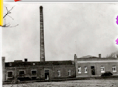
Anno 1942: Die Webers Mühle Gründung des heute ältesten Textilunternehmens im nördersächsischen Borken durch den Kolonialwarenhändler Wilhelm Walling.