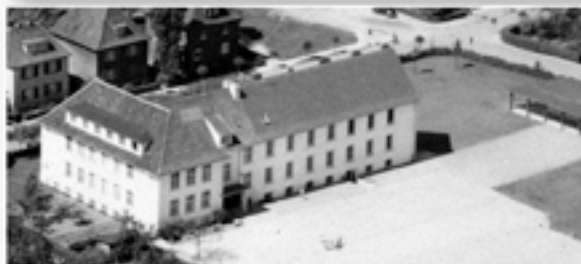
Der Schulhof der Paulskamp-Schule