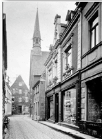
Anno 1942 Heilig-Geist-Strasse Kopfsteinpflaster und kleine beschauliche Geschäfte prägen das Bild der Borkener Innenstadt.